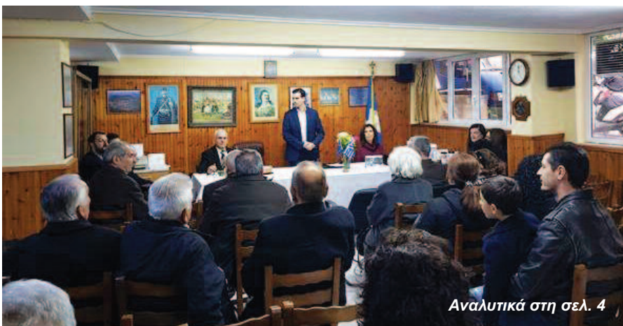
Αναλυτικά στη σελ. 4