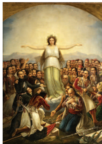
Πίνακας ζωγραφικής "Η Ελλάς ευγνωμονούσα, 1858" Βρυζάκης Θεόδωρος